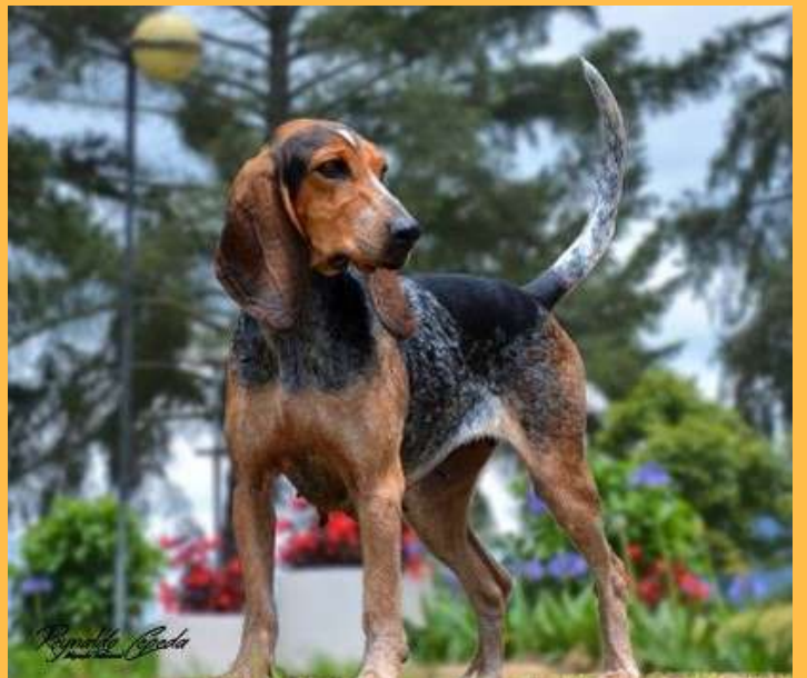
Diseñado por CARLOS QUIÑONES